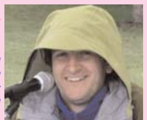
Il travestimento di Icio per sfuggire ai contadini: verde...come le verze!